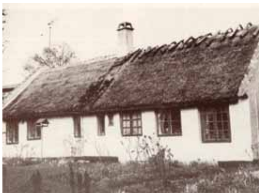
Foto af bygningen Vangede Bygade 52 (bag det tidligere posthus). Huset er helt unik et bevaret bondestuehus fra før udskiftningen i 1766, idet gården, der senere fik navnet Fuglegården lå her. Dengang var huset på seks fag, og det er den østlige del, der er bevaret. Et skøde fra 1775 fortæller, at bonden solgte gårdens grund og hus. Huset står på den gamle kampestenssokkel fra før 1766, men det lerklinede bindingsværk er senere sat i rigtigt murværk.

Eftertiden måtte give Bernstorff ret i, at selvejet medførte en produktionsstigning. Efterhånden blev der velstand på de nye udflyttergårde, men samtidig opstod også en ny underklasse blandt besiddelsesløse husmænd, der mistede deres gamle rettigheder til blandt andet græsning på fællesarealerne. Taknemmelige bønder indsamlede helt frivilligt i 1783 penge til en støtte, der blev rejst ved Lyngbyvejen til Bernstorffs ære.