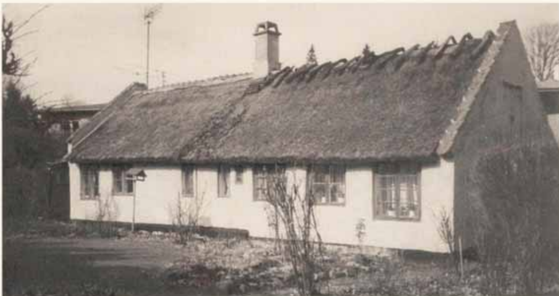
Vangede's ældste hus.

Denne mere end 220 år gamle bygning burde egentlig fredes.