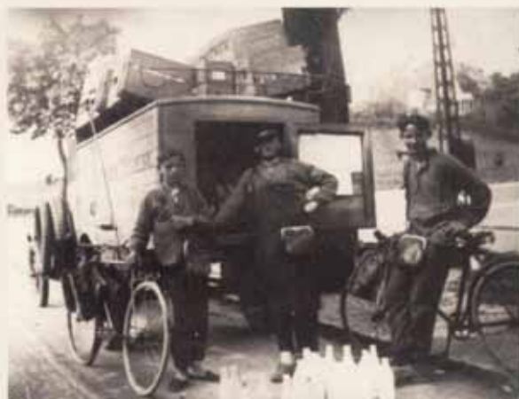
Mælkedrenge ca. 1930 - holder en sikkert vel fortjent pause!