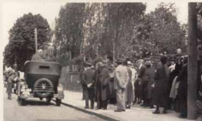
Opløb i Vangede? - En del beundre vel den smarte automobil.