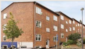
Vangede Bygade 86, 2. tv. SOLGT VIA KØBERKARTOTEK

LokalBolig Gentofte & Vangede Gentoftegade 34 2820 Gentofte