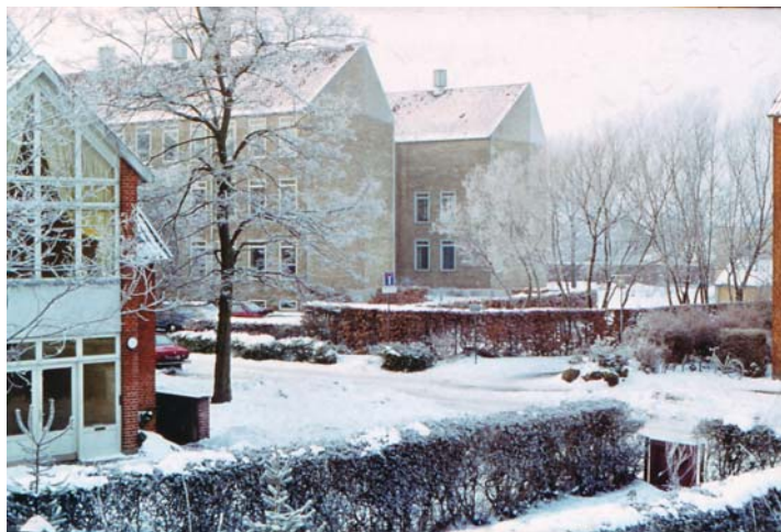
Vinterlandskab. Mosegårdsskolen (nu Nymosehave i baggrunden).

Dengang jeg var barn, var der også vintre, der ville noget. Der var ofte meterhøje sneedriver, og der blev flittigt kreeret snemænd med gulerodsnæser og det hele. Der blev bygget snehuler i stor stil med vinduer, og der blev kælket på Vangede Fort. Der var to gode kælkebakker derovre – Hjørnebakken og Djævlebakken, og når frosten satte sig fast, så blev der hurtigt dannet is på bakkerne, og det blev en udfordring, at vove turen på kælken,