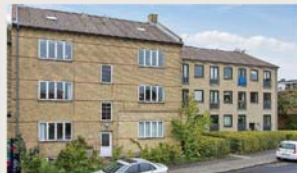
Vangede Bygade 103, 2. th. OVERTAGET FRA ANDEN MÆGLER