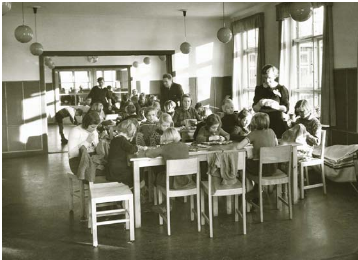
Fritidshjemmet blev oprettet i 1938 i november 1940 blev den nye bygning på Nørrebakken indviet. Her ses piger og drenge i 1940 igang med deres sysler.