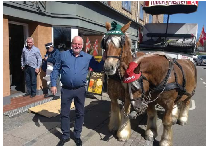
Torben fra Diligencen og et par bryggerheste

Er der chancer på Diligencen Er der stadigvæk liv i dit liv Hvis den røde rammer kassehullet Ja så ved du, at du er for stiv