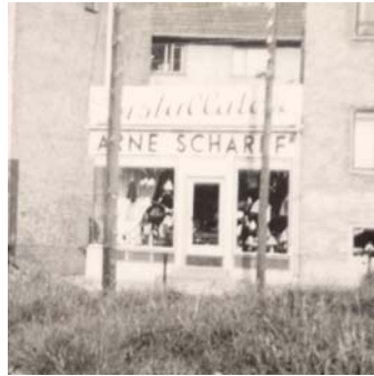
Butikken set udefra.