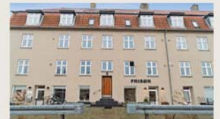
Ellegårdsvej 25, 2. th. SOLGT PÅ 26 DAGE