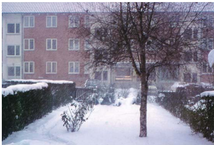
Sne i haven