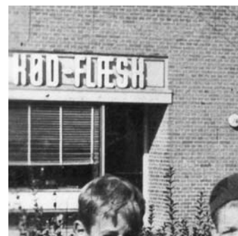
Slagterforretningen på Stolpehøj.