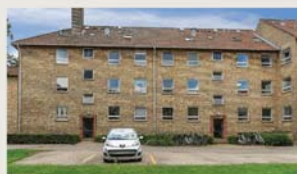
Tværboommen 21, 1. th. SOLGT - LIGNENDE SØGES