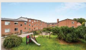
Snogegårdsvej 8J, 1. tv. SOLGT VIA KØBERKARTOTEK