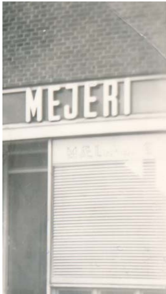
Mejeriet på Stolpehøj

Lå ved siden af ismejeriet, et lille men travlt sted.