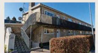
Ellegårdsvej 23, st. 2. SOLGT PÅ 44 DAGE