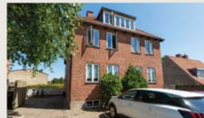
Ellegårdsvej 88, 2. tv. SOLGT PÅ 20 DAGE