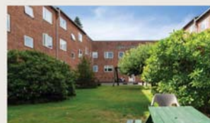
Vangede Bygade 66, 1. tv. SOLGT VIA KØBERKARTOTEK