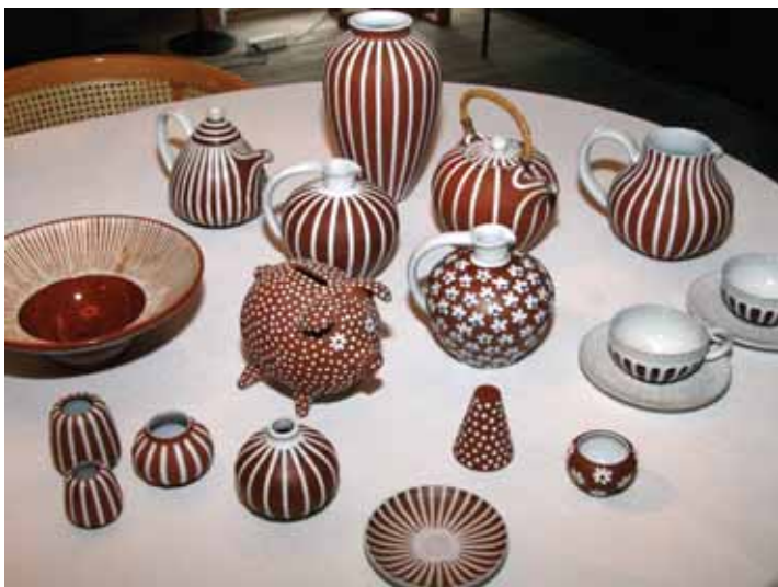
Et udvalg af Zeuthen Keramiks produkter