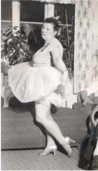
Fire, 1955. Billedet er taget få øjeblikke før måsen gik op i røg.

Man slog katten af tønden med stivfrosne fingre, for vanter og overtøj, passede ikke sammen med udklædning. I tønden var der ofte appelsiner. Der blev kronet en kattekonge og der var en mindre krone for bedste udklædning. Vi fik mange kroner i vores familie.