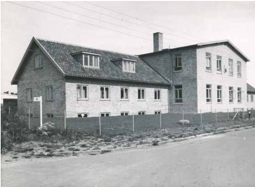
Ejendommen på hjørnet af Bomporten og Tværbommen