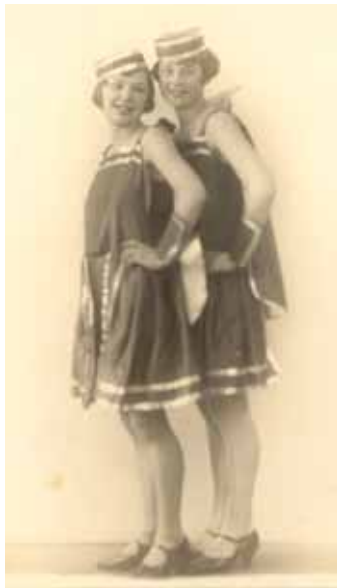
Oldemor og Oldefire ca. 1920

Moster Fire optrådte i 1955 som balletpige ved et af disse private baller.