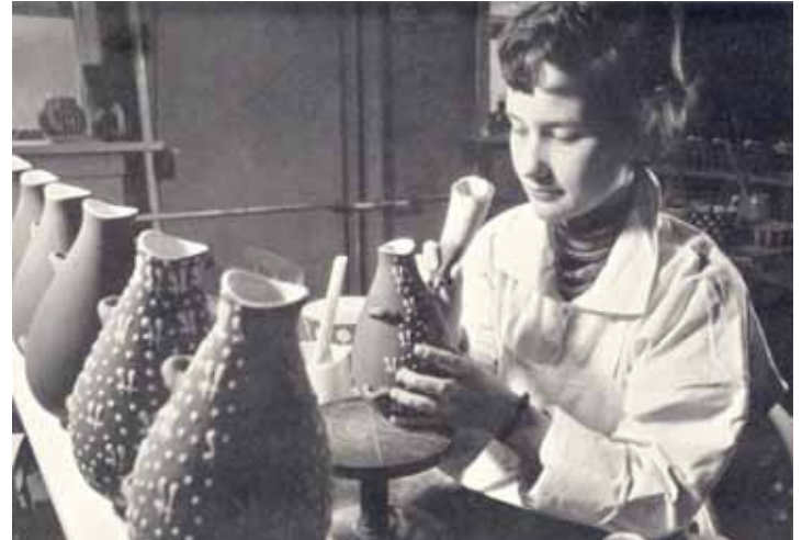
I kælderen sad tre drejere. Efter lertøjet var tørret blev det brændt. I stueetagen sad 19 dekoratører. Efter det var dekoreret blev det brændt igen.

stadig stigende produktion af reproduktioner – og Rammefabrik.