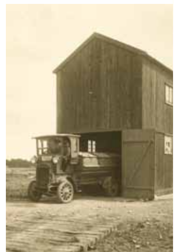
Skraldevogn er ved at læsse dagrenovation af foran aflæsningsskuret på lossepladsen ved Stolpegården, 1919.