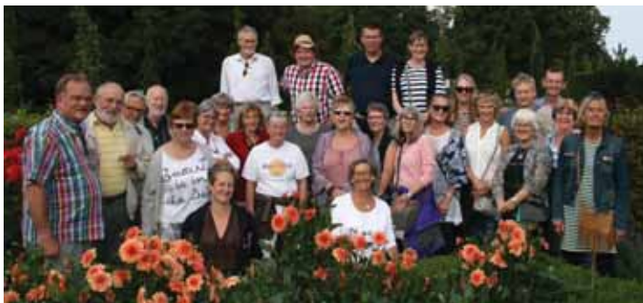
De caféfrivillige på sommerudflugt i Rosenhaven i Valbyparken.