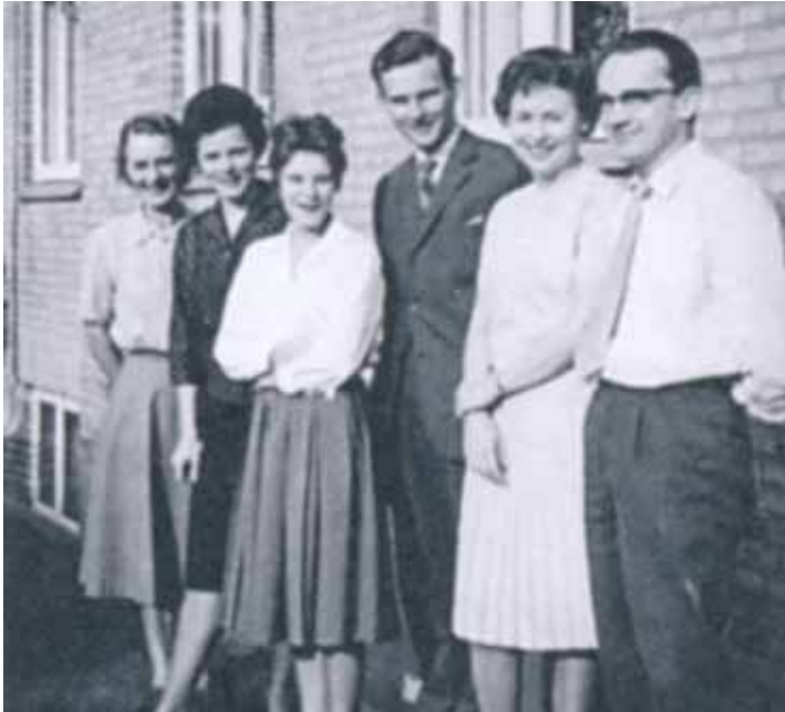
Personal hos NTI – administrationen og fabrikationen.

gen til, at man flyttede til næsten helt nye lokaler i Vangede på adressen Bomporten nr. 1.