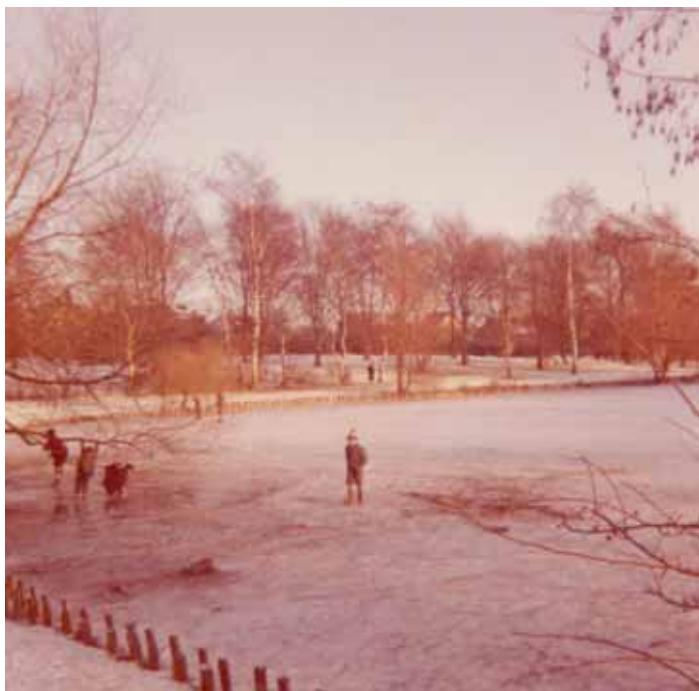
Nymosen. Skiltet med "Isen er usikker" var der sikkert stadig, men det var der ingen, der tog notits af.

Da pottemageren døde, kommer der en ny ejer, og vi fik installeret toilet i lejlighederne. Sikken en luksus. Aldrig mere ned i gården, hvor der kun var et wc til alle.