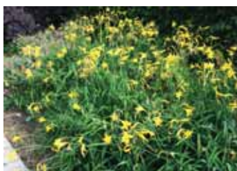
Mange planter bliver bevaret på Bank-Mikkelsens Vej

Mange har spurgt til, hvad der skal ske med de mange fine gamle stauder og buske i området, når byggeriet går i gang. I samarbejde med landskabsarkitekten på projektet fra tegnestuen Vandkunsten er der lagt en plan, som skal sikre, at så mange af de værdifulde planter som muligt kan bevares. F.eks. bliver nogle af planterne flyttet midlertidigt til Mariebjerg Kirkegård i løbet af efteråret. Der vil de blive passet og plejet, indtil de kan komme tilbage og blive plantet igen i de nye haver og på de nye friarealer.