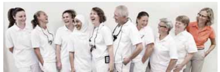
Klinikkens kompetente team holder tandhjulene godt i gang.