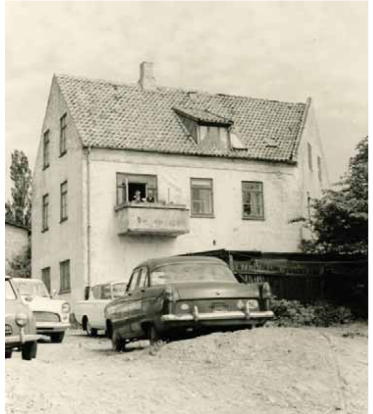
Huset der rummer flere lejligheder set fra gården med biler fra ejendommens bilværksted. Huset blev nedrevet ca. 1968.

Man kunne godt få en lussing af læreren, hvis man ikke var ordentlig. Man kunne også få en eftersidning, så skulle man blive en time ekstra om eftermiddagen.