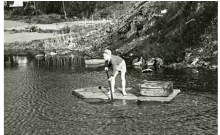
En dreng leger i et vandhul ved Hellesens fabrikker, en rest fra de gamle teglværksgrave, 1955. Vandet i de små vandhuller omkring elementfabrikken var ofte turkisgrønt.

Så fik både store og små i Vangede travlt med at lede efter de pengesedler, som passede sammen – men det var der vist ingen, der gjorde!