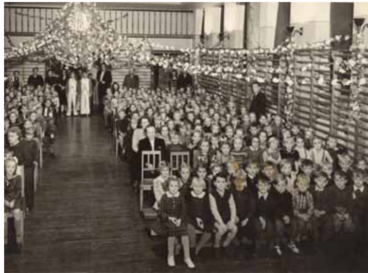
Et billede fra den festlige afgang fra Tjørnegårdsskolen i 1950, da en del af eleverne skulle skifte til den nye Mosegårdsskole på Stolpehøj. Billedet er taget i en af Tjørnegårdsskolens gymnastiksale. Vi sendte billedet til Tjørnegårdsskolen for at få bekræftet at det var fra deres gymnastiksal, men de kunne ikke genkende det, så lagde vi det ud på facebook og her er der flere der har genkendt billedet. Vi er herefter overbevist om at det er fra Tjørnegård at dem vi har spurgt på skolen bare ikke ved, hvordan den gamle gymnastiksal så ud. Vi skal huske at Tjørnegårdsskolen også er blevet ombygget til nutidens skolegang og ser helt anderledes ud i dag.

– sådan en var der ikke på Mosegårdsskolen, ligesom stolene også ser ret brugte ud