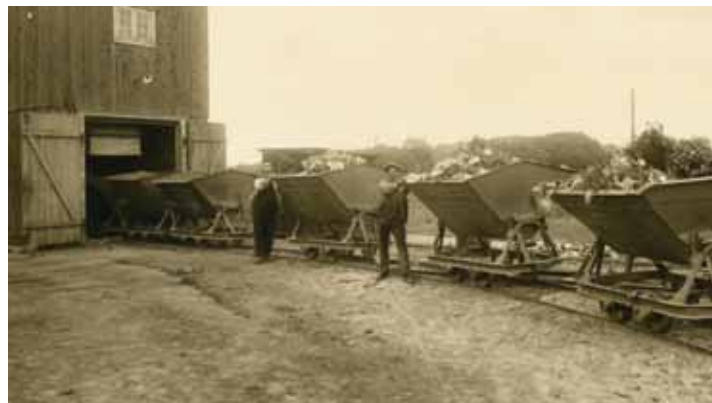
Udkørsel af dagrenovation med tipvogne på lossepladsen, Ca. 1919. Find flere gamle billeder på danskebilleder.dk

Lossepladsen i den gamle grusgrav ved Stolpegårdsvej benyttedes i årene efter 1931 endnu til storskrald og til haveaffald. Mange Vangedeborgere vil nok erindre, at sportsgrene som rottejagt og klunsning blev drevet i vidt omfang. Dan Turèll