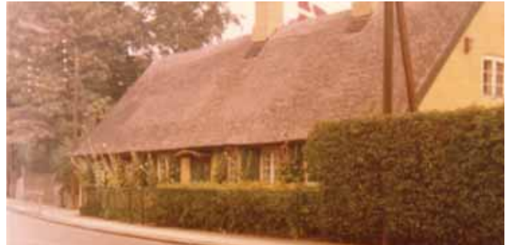
Bemærk kirkemuren til venstre i billedet. Foto fra ca. 1965 venligst udlånt af Bendt Knudsen

Hent vores efterårsprogram i klubben, Vangede Bygade 55 (onsdag lukket).