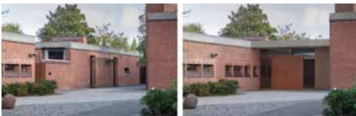
Eksisterende (tv.) og fremtidige (th.) forhold – set fra Vangede Bygade mod nordøst

Kgl. Bygningsinspektør: Fogh og Føllner.