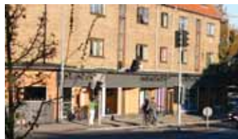
Efter vejhuset blev nedrevet blev dette hus bygget