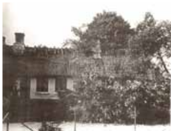
Vangedevej 12 i ca. 1930 set fra baghaven, hvor oldefar åbenbart havde visse rettigheder. Jeg ved ikke om man i 1919 kaldte det en aftægtskontrakt, men det ligner meget.

Han fik ved sit 25 års jubilæum foræret en forsølvvet opsats