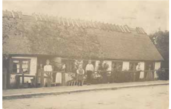
Billedet er fra 1915-1920. Far fortalte ofte, hvem personerne var, men det har jeg desværre glemt