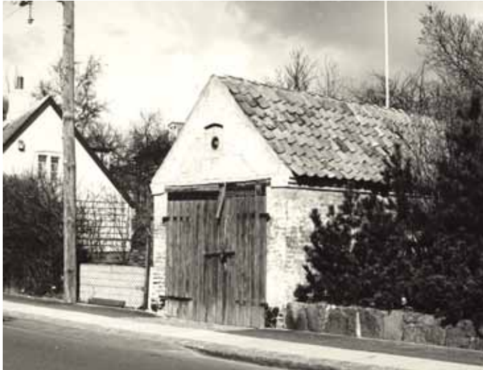
Det gamle sprøjtehus. Til venstre i billedet ses en lille bid af Charlotteklubben.

På den modsatte side af gaden var der posthus i det lave gule hus, som nu rummer Charlotteklubben. Ved siden af lå det gamle pumpehus med en brand-sprøjte, som blev trukket og betjent manuelt.