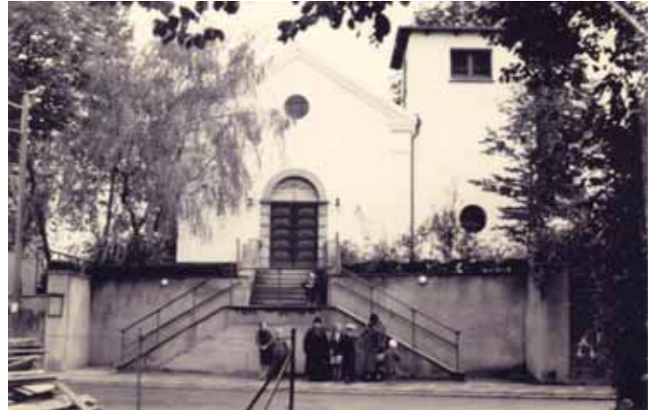
Den gamle Vangede Kirke lå, hvor biblioteket ligger i dag. Ved siden af lå menighedshuset, der også var skolestue for de mindste klasser.