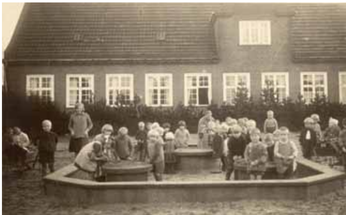
Det var ikke altid fryd og gammen at gå i Asylet. Hårdhændet behandling og ydmygelser var en del af dagligdagen. Men børnene var i hvert fald rene.