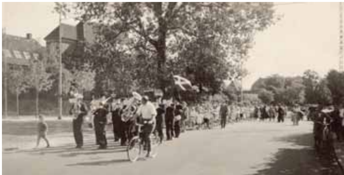
På dette foto fra 1950 går elever og lærere i samlet flok fra Tjørnegårdsskole til den nye Mosegårdsskole.

Jeg blev født i Vangede i 1942. Der var ingen skoler for Tyskerne havde ødelagt Tjørnegårdsskolen ved slutningen af krigen. De havde brugt Tjørnegårdsskolen som hospital under krigen og da der var blevet født utrolige mange under krigen måtte man tage kirken i brug til skole. Men der var kun et værelse, så da der var to første klasser måtte den ene klasse gå i skole om morgenen og den anden om eftermiddag. Der var også et hold, der gik nede ved præsten, hvor vi havde søndagsskole og ungdomsklub.