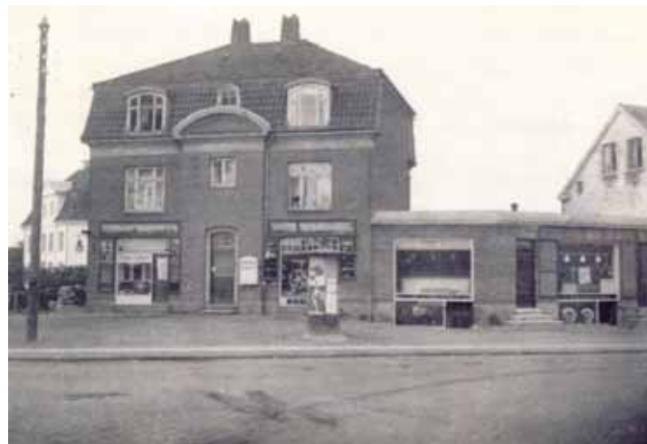
På hjørnet af Lyngbyvej og Vangedevej (nu Brogårdsvej) lå mange butikker. Bemærk Plakatsøjlen, der nu står på den anden side af Lyngbyvejen.

Min mor sagde til mig, jeg skulle gå ud og vaske mig, da jeg lugtede af heste. Min far var klædt om og fortalte, at han