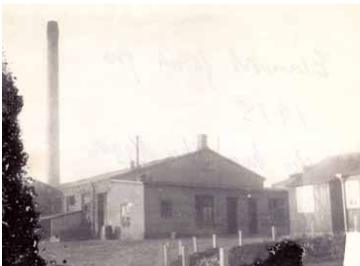
Elementfabrikken. Foto fra 1915

Da jeg kom hjem fra skole sagde jeg ikke noget om det til mine forældre.