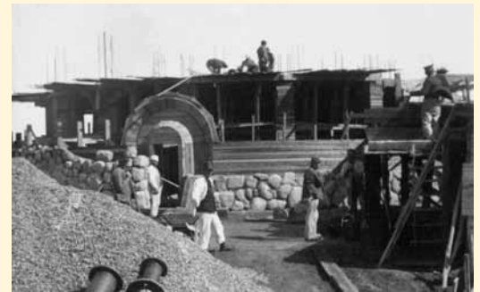
Vandtårnet under opførelse 1905