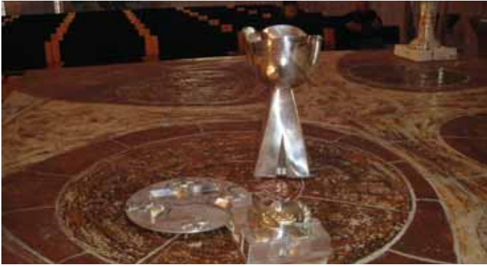
Det nye altersølv

Spejderne er de primære brugere af Ungdomsgården.