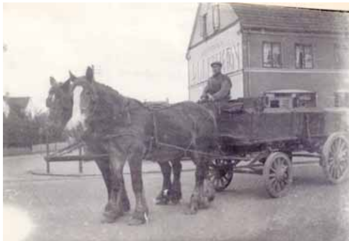
Hestevogn på Lyngbyvejen.

Næste morgen, da jeg skulle i skole, gik jeg en anden vej. Jeg kom hen på en markvej, som i dag hedder Søbredden.