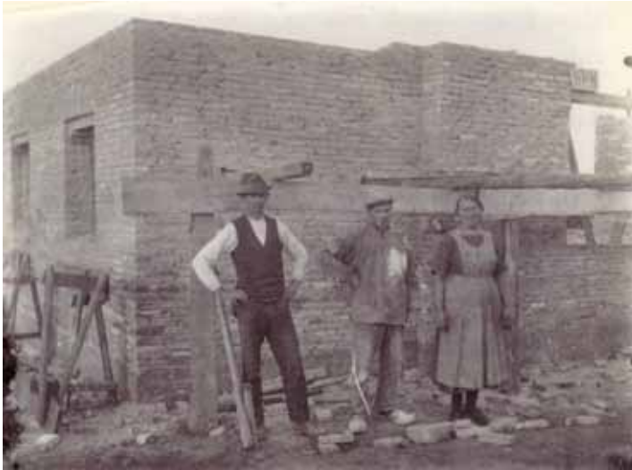
Min farfar, far og farmor byggede hus på Middelvej 22.

skulle til møde på rådhuset på grund af mig, fordi jeg ikke havde været i skole.