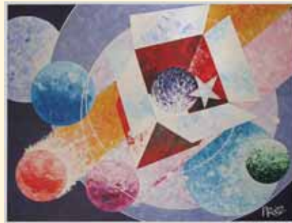
Maleri af Poul Reinhardt

Se mere om de enkelte udstillinger på Vangedes hjemmeside www.vangede.dk