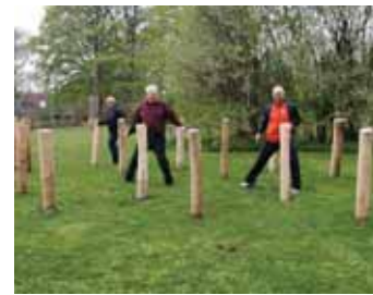
1: "Kongens efterfølger" mellem pæle – træner ben og hurtighed