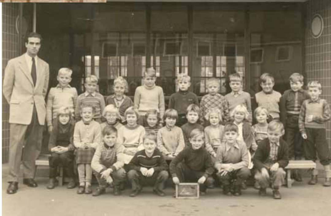
Klassebillede fra Mosegårdsskolen.