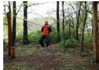
2: Armhævnninger i tovet – træner arme og overkrop