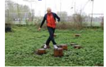
4: Hop fra pæl til pæl – træner ben og balance

Se flere træningsforslag på www.vangede.dk