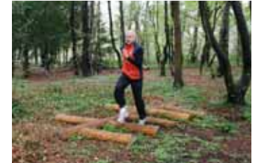
6: Sprint med isætning af fod mellem plankerne – træner ben og hurtighed