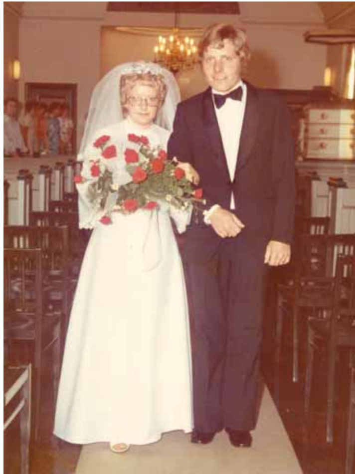
Det nygifte par i den gamle Vangede Kirke.