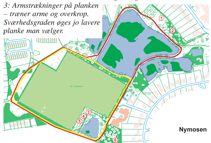
Oversigtskort over Nymosen med den røde 1,5 km-rute og den gule 1 km-rute. Tallene henviser til træningsstationerne – se anvisninger under fotografierne.