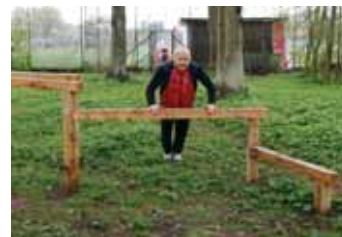
3: Armstrækninger på planken – træner arme og overkrop. Sværhedsgraden øges jo lavere planke man vælger.