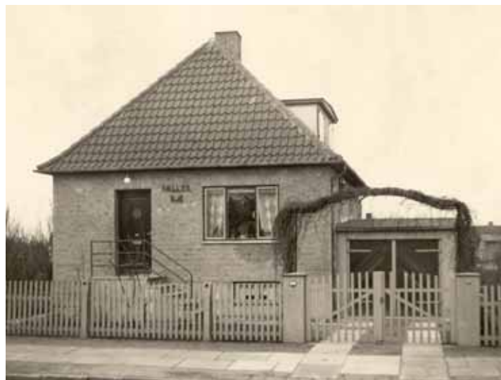
↑ Det færdige hus.