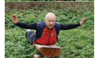
5: Mavebøjninger – træner maven og Rygbøjninger – træner ryggen