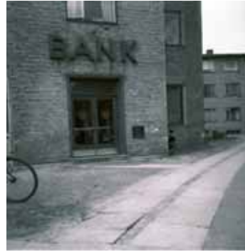
I 1939 åbnede Ordrup-Charlottenlund Bank en Vangedefilial i lokallet, der senere blev posthuset.

hans lejlighed kun var på tre værelser, besluttede jeg mig for at spørge ham, hvad han brugte så mange kakkelovne til.