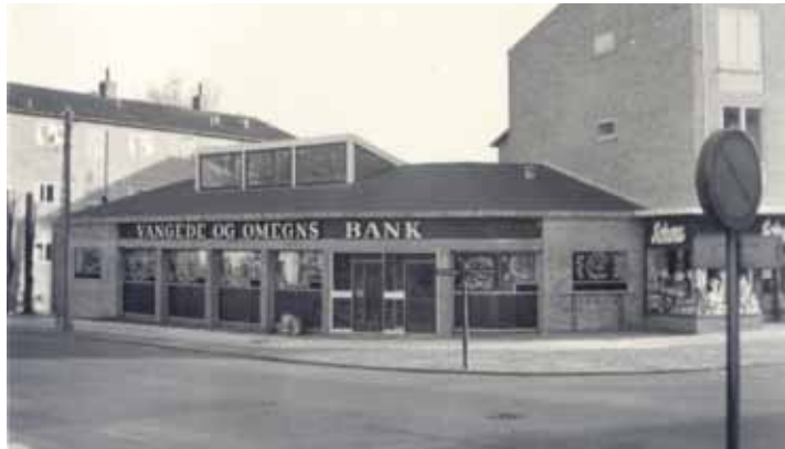
I 1958 havde banken fået vokseværk og flyttede til nybyggede lokaler på hjørnet af Vangedevej (nuværende Vangede Bygade) og Snogegårdsvej. Vangede og omegns Bank var stadig en filial af Ordrup-Charlottenlund Bank. På denne plads lå der tidligere byens gadekær

En mand henvendte sig for nogle år siden til mig og bad om at låne penge til en kakkelovn. Afdragene faldt promte, og da han senere skulle låne til endnu en kakkelovn, hjalp vi ham selvfølgelig igen. Til sidst havde han lånt penge til fem ovne. Da