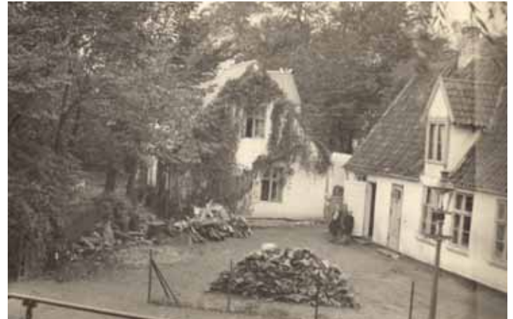
Huset på billedet lå over for den gamle kirke.

I samarbejde med Lokalhistorisk Arkiv vil vi meget gerne låne billeder eller udklip til brug i Vangede Avis og evt. i en kommende bog om livet i Vangede.