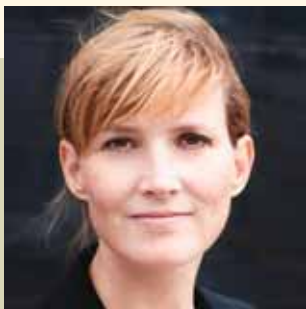
Benedikte Kiær (K) Socialminister