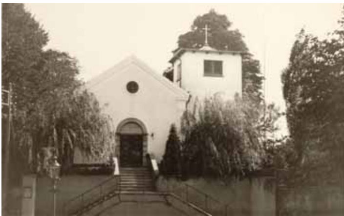
Der gik jeg i skole, blev konfirmeret, mine børn er døbt der, og i 32 år har den været min genbo. Jeg glæder mig over, at en gammel skole kunne blive så yndig en kirke. Det er med en vis vemod man ser, at den ikke benyttes mere, men en glæde, at den er afløst af vel den smukkeste kirke i kommunen.

Vangede, der jo er en del af Danmarks rigeste kommune,