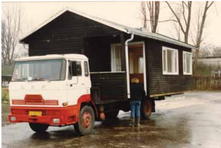
Huset ankommer på lastbil.

Man er i pagt med naturen og årstiderne, som har langt større betydning, end hvis man sidder på kontor eller ved kassen i et supermarked. Det er nemlig ikke lige meget, hvad man gør på hvilket tidspunkt, hvis man ger-