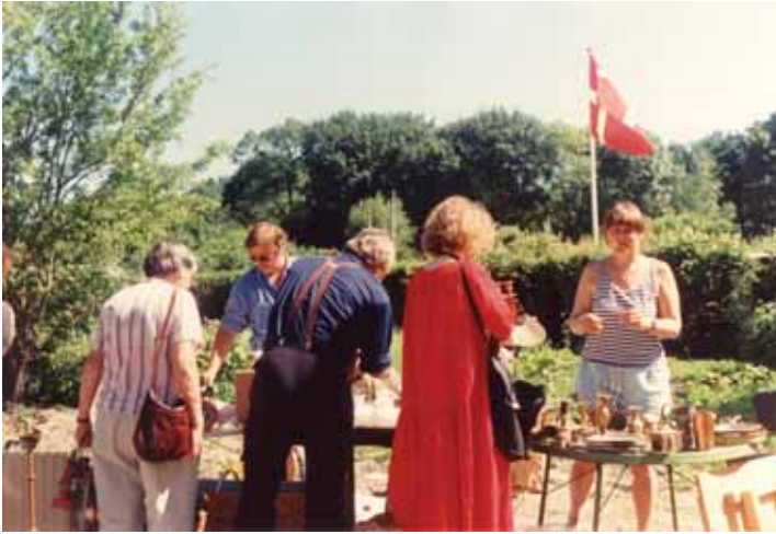
Loppemarked i Knæbjerg