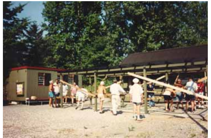
Smedens hus flyttes, da kommunen har solgt grunden til et amerikansk firma.