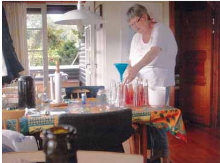
Anne laver kryddersnaps til loppemarkedet.

"Jeg synes, at det er vigtig, at vi har steder som 'Knæbjerget'. Dels er det et rekreativt område