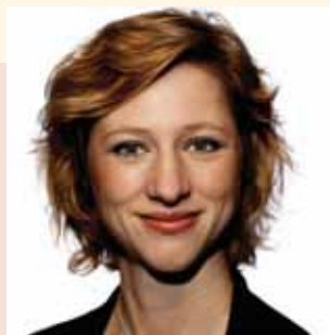
Sophie Hæstorp Andersen MF (S)