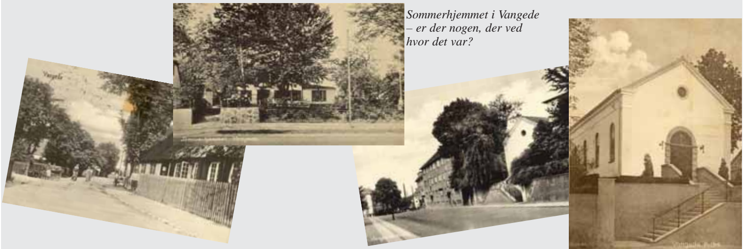
Sommerhjemmet i Vangede – er der nogen, der ved hvor det var?