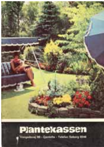
Forsiden af Brochure fra midten af 1960-erne visende tidens havestil.