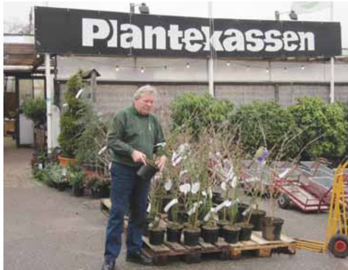
Plantekassens butiksfacade set fra parkeringspladsen.