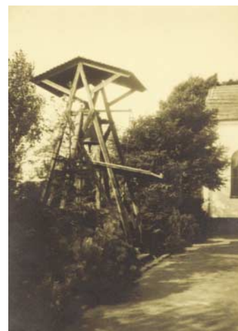
Forgængeren til kampanilen var dette klokketårn bygget af træ, hvor Vangedes enlige kirkeklokke ringede til gudstjeneste. Tårnet fungerede fra 1926 til 1932.

er rigtig flot murerhåndværk. Den er meget speciel, hvor store