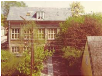
Menighedshus set tværs over bygaden, i forgrunden Charlotteklubben.