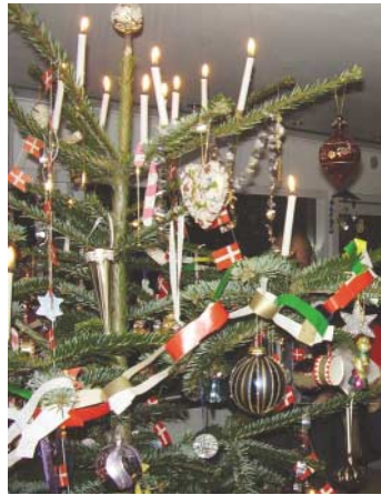
Julestemning i Vangedes stuer med et træ fra spejderne.

Vangede gruppe skal til sommer på korpslejr ved Skive. En lejr, hvor mere en 20.000 spejdere fra Danmark og fra udenlandske gæstetropper, vil deltage. Og en lejr, der også 100% er baseret på frivillighed. Alene transport til Skive gør en sådan korpslejr ganske dyr, men pga. juletræssalget kan vi give deltagerne et pænt tilskud, der gør det muligt for alle "høj som lav" at deltage.