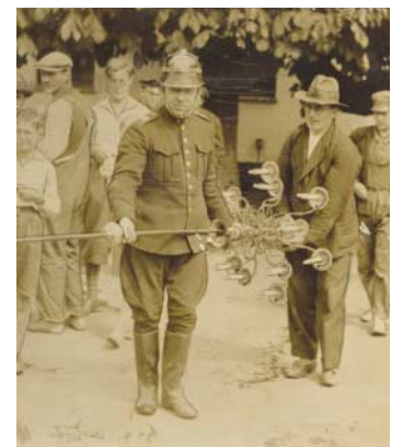
Under branden reddes lysekronen ud af kirken.

gennem der sendtes varm luft. Familien flyttede en etage ned mens operationen stod på, men den varme luft gjorde, at maling på døre og karme boblede og smeltede. Husbukkene forsvandt, men desværre udbrød der brand i loftsetagen over kirkesalen ved uforsigtighed. Selvom brandvæsenet hurtigt kom tilstede, udbrændte tagkonstruktionen, men selve kirkesalen forblev intakt. Under branden reddede Bendts far kirkens lysekroner ud af den brændende kirke.