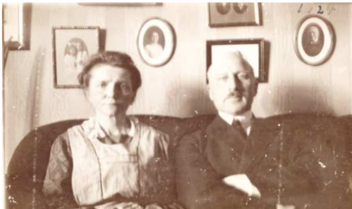
Ritas mor og far.

På sofabordet i stuen står et en vase med visne blomster. Det ser ud til at have været en både dyr og smuk buket. "Den stammer fra min 100 fødselsdag d. 4. september, som blev fejret med åbent hus, hvor mere end 100 mennesker besøgte mig", fortæller hun glædesstrålende.