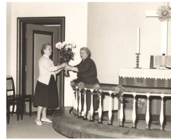
Alteret pyntes op til en kirkelig højtid af Bendts mor og søster.

Kirkeklokken hang midlertidigt i en klokkestabel, ligesom det tit ses ved jyske kirker. På et tidspunkt rejste menighedsrådet et lidt lavstammet kirketårn ved siden af kirkens facade mod Vangede Bygade, der dengang hed Vangedevej. Tårnet var i to etager og normal ringning foregik fra den nederste. Her var der et tykt tov til at svinge klokken, mens der var et tyndere reb til at slå de ni bedeslag. Ved juletid, hvor klokkerne skulle kime eks-