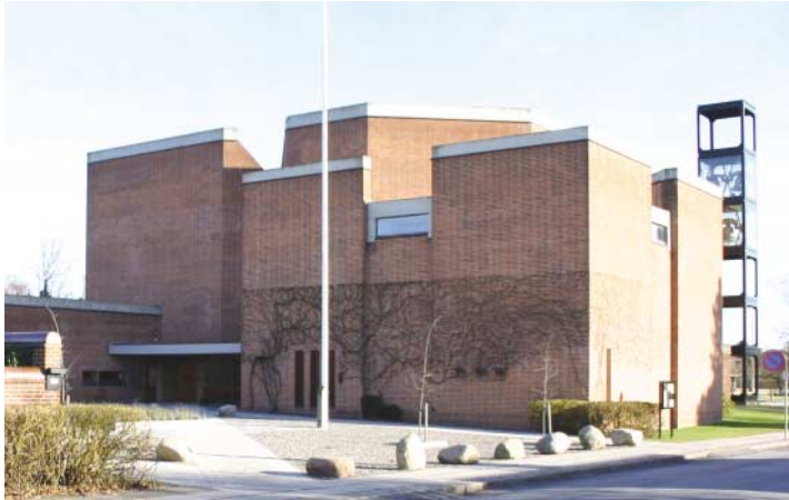
Vangedes nationale seværdighed

gelopbygningen. Lysekronerne svæver som glories over bænkerader, alter og orgel.