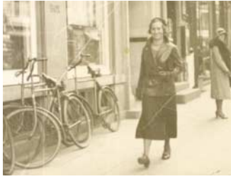
Ritta på støgtur.

være fyldt 18 år. Jeg fik også et job som ung pige hos skolebestyrerinden og hjalp bl.a. til i hendes feriehus i Humlebæk.”