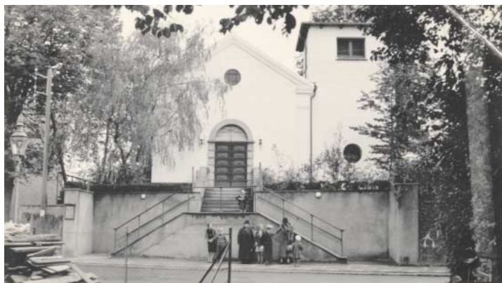
Den gamle kirke, der lå der hvor biblioteket ligger nu

Men glæden var kort. Det viste sig, at tagspærene var ved at blive undermineret af et billeangreb, der havde været undervejs i flere år. Under bekæmpelsesforsøget på skadedyrene i 1932 gik der ild i tagkonstruktionen, og dele af hvælvingerne styrtede ned. Ved genopførelsen ændrede man kirken, så der nu blev siddeplads til 180 kirkegænger. Bygningerne havde også flere anvendelser bl.a. som mødesal og søndagsskole.