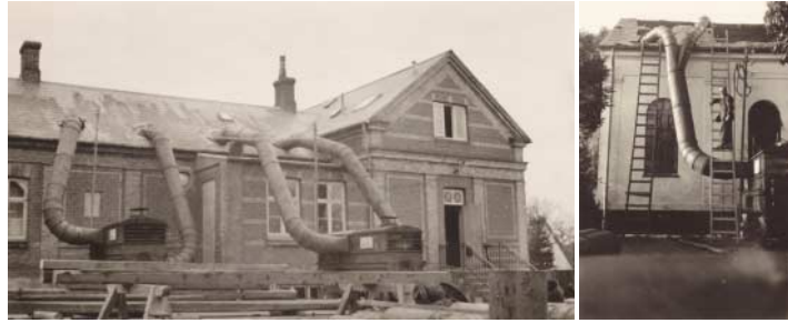
Varmeslanger er lagt ind under tagkonstruktionen for at udrydde skadedyr.

Bendt startede i skole i 1937 i den nyopførte Bakkegårdsskole i en klasse med 28 elever, skolen havde på dette tidspunkt over 800 elever. Her gik han så til og med 7. klasse, det var almindeligt at forlade skolen efter de obligatoriske syv år.