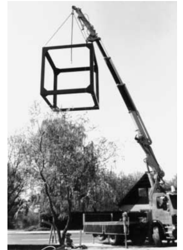
I 1996 blev von Spreckelsens egne tegninger til det karakteristiske klokketårn endelig realiseret. Her hejses en af de seks stålrammer fra Bornholm på plads.

som et vartegn for Vangede, hvor Bygaden og Vangedevej adskilles. Den er blevet et identitetsskabende symbol for det nye Vangede og en stolthed for kommunen. Vangede er kommet på arkitekturens verdenskort med von Spreckelsens mesterstykke.