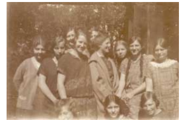
Pigerne på realskolen.

Engang jeg var oppe hos dameskrædderen, havde jeg ‘stjålet’ nogle nipsenåle, fordi at jeg