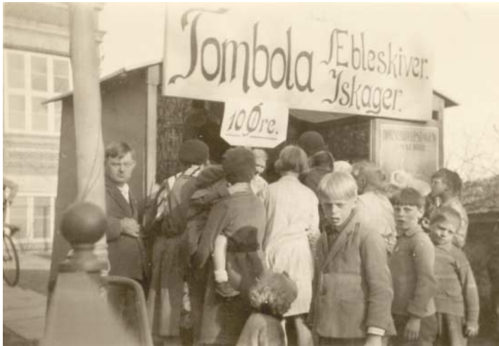
Til finansiering af kirkebyggeri foregik der igennem mange år en stor indsats med mange forskellige aktiviteter; her ses en tombola udvidet med salg af æbleskiver og is!