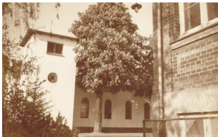
Kirkepladsen med kirke og menighedshus.