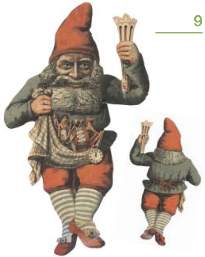
Nissen fra træets top.

Et stykke tid betragtede vi træet, men så trængte kulden ind