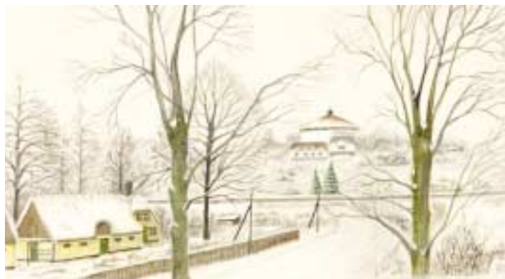
Snelandskab med ræveskovvandtårnet. Udsigt fra mit værelse, Brogården 1942 akvarel af Oscar Fiehn.

Min kusine med mand og to små piger var på det tidspunkt flyttet ind i samme ejendom, så da julen nærmede sig og sneen for en gangs skyld lå højt, besluttede min far sig for at være julemand og aflægge dem et besøg. Da mørket faldt på, drog han afsted iført min mors røde morgenkåbe, nissehue, hvidt skæg og sæk med gaver, blandt andet to nyslagede høns, hvor fødderne stak ovenud af sækken. Vi kunne se ham gå over marken, til han kom til Lyngbyvejen, som dengang var en smal brolagt landevej, her var han ved at skabe lidt kaos i juletrafikken, da flere standsede op for at deres børn endelig kunne se en rigtig julemand. Da han kom hjem, fortalte han, at det var blevet en fiasko. I døren var han blevet mødt af to par forventningsfulde barneøjne, men da sækken blev stillet i entreen og hønsefødderne kom til syne, forsvandt pigerne højt skrigende ind i stuen og ville ikke komme frem før den væmmelige julemand var gået. Efter således at have berøvet børnene deres barnetro, opgav min far sin karriere som familiens julemand.