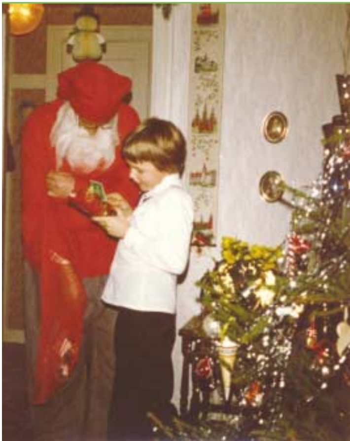
Julemanden på besøg. På 1. sal hos farmor og farfar, 1985.

sker den fæle lugt af stjerneka- sternes våde krudt.