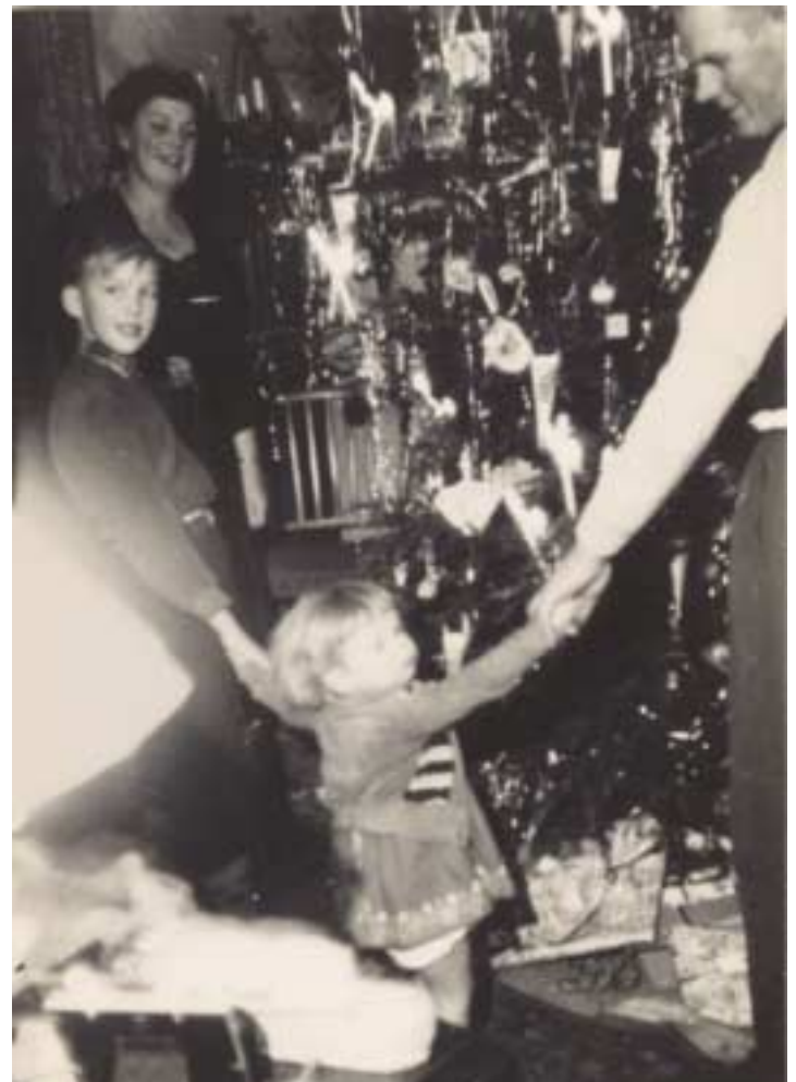
Rundt om træet. Moster 4's søn, farmor, farfar og jeg, 1955.

I min erindring var der altid sne, men virkeligheden var nok, at det tit støvregnede, for jeg hu-