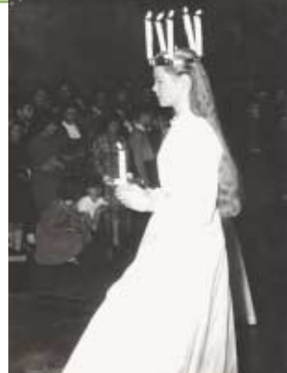
Den smukke luciabrud på Mosegårdsskolen 1955.

På de fleste skoler arrangeres luciaoptog. Det er en svensk tradition, hvor de unge piger klædt i hvidt med lyskrans i håret går i optog og synger luciasangen.