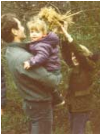
Juleneget sættes op. 1983

mødtes vi alle hos moster 4 til morgenbord, og morgenbordet var dækket med alt, hvad hjertet ikke havde godt af! Der var lun