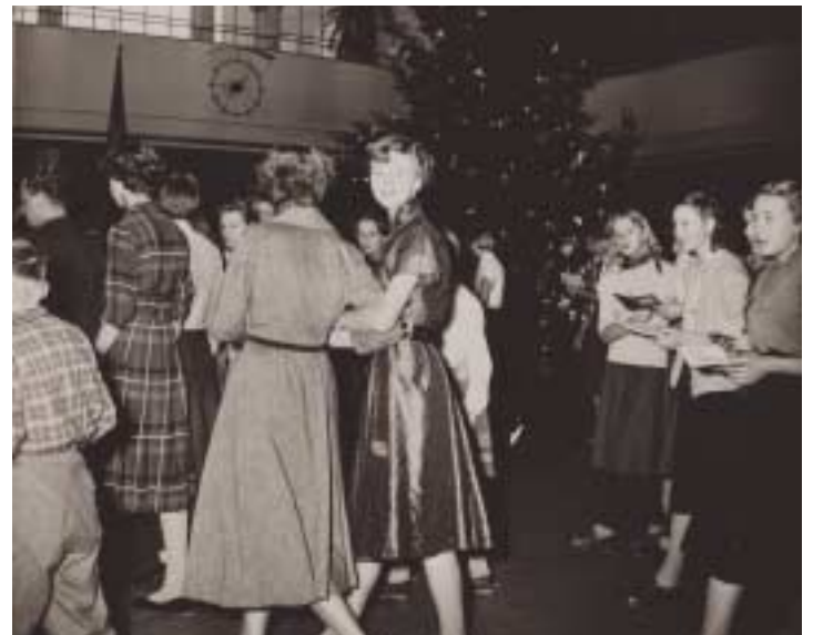
Juleafslutningsfest på Mosegårdsskolen 1955. Mosegårdsskolen eksisterede fra 1950-1988, og blev derefter ombygget til ældreboliger kaldet Nymosehave.

Hurtig mad af friske kvalitets- produkter til en pris der giver råd til mere.