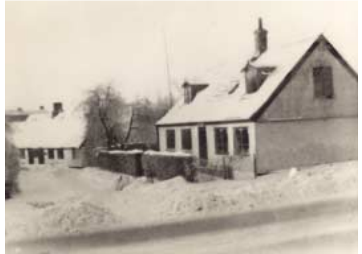
Forrest i billedet ses huset "Ellebo" i baggrunden ses "Sladre-rækken".

Som mange af Vangedes raske drenge havde jeg min gang i GVI nær Nymosen. Det var naturligt at søge derned, da min far og storebror også kom der. Vi spillede fodbold og hele mit liv har været formet af GVI, her mødte jeg min kone og mine nærmeste venner, sidstnævnte mødes jeg med til et træf den sidste torsdag i hver måned: "Senior boys". Men vi spiller ikke bold mere, det er vi blevet for gamle til, vi hygger os med minderne fra dengang. GVI spillede i Sjællandsserien og vi kan sta-