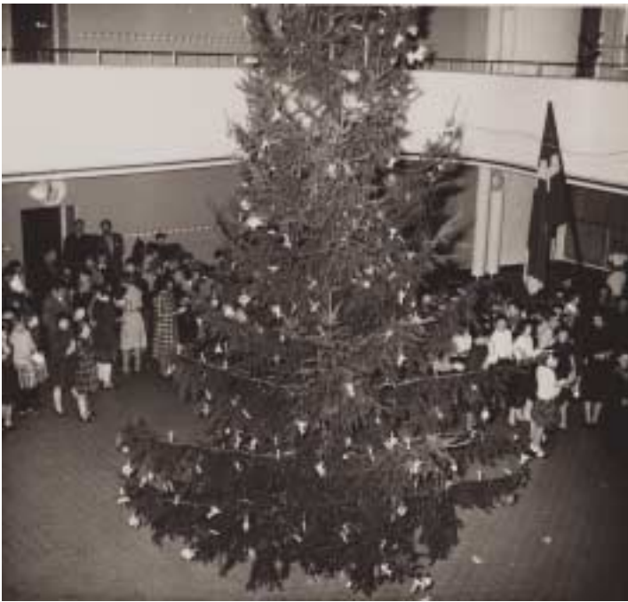
Juletræet med al sin pynt og glans på Mosegårdsskolen 1955.

Har du julebilleder fra din skoletid liggende i dine skuffer eller på loftet, så hører Lokalhistorisk Arkiv meget gerne fra dig. Henvendelse til: Lokalhistorisk Arkiv, 39 98 58 20 eller lokalarkiv@gentofte.bibnet.dk.